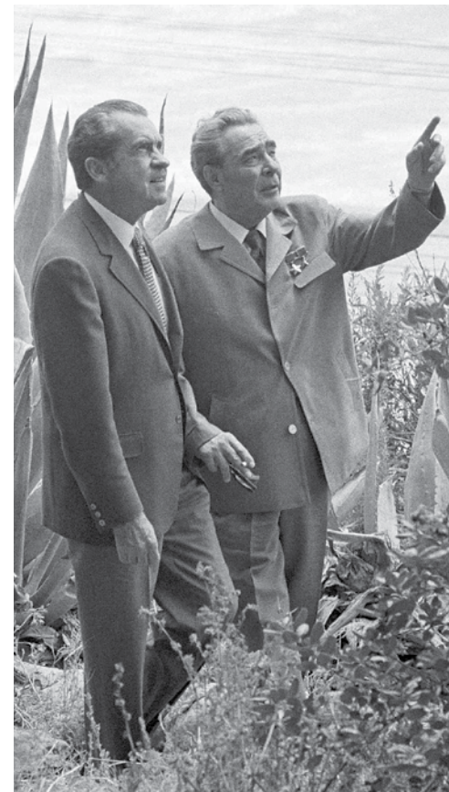
Sommeren 1973 besøkte den sovjetiske partisjefen Leonid Bresjnev den amerikanske presidenten Richard Nixon i San Clemente.