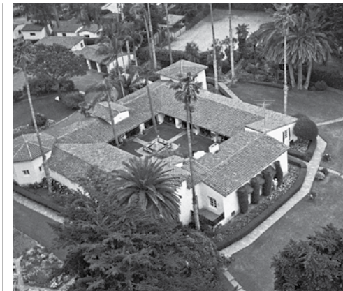
Richard og Pat Nixons bolig i San Clemente ble gjerne kalt «Western White House». I 2015 ble det lagt ut for salg for nær en halv milliard kroner.

I dag bor det ca. 68.000 mennesker i denne kystperlen. Det er et yrende liv med hundre- talls surfer i bølgene, fiskere på piren, små- barnsfamilier på hvite sandstrender. En flere kilometer lang strandpromenade er populær blant turgåere og joggere til alle døgnets tider. Små butikker og kaféer slynger seg langs det glitrende havet, mens den grønne parken med palmer og benker inviterer til en rolig time-out.