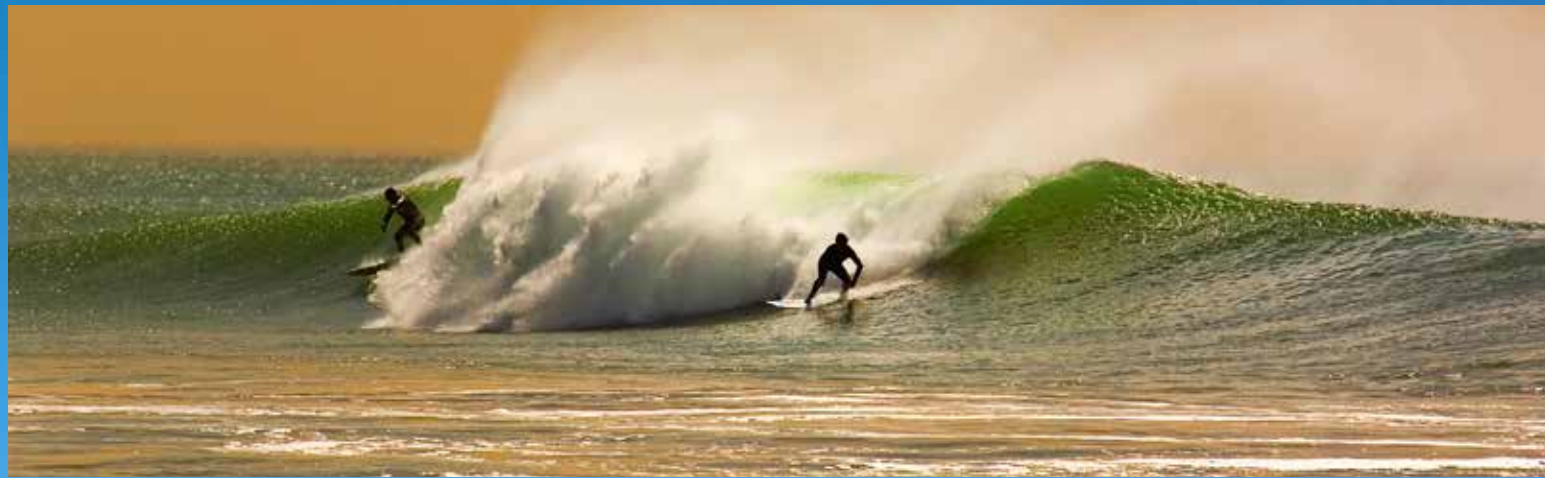
Surfer Magazine har plassert San Clemente på 5. plass over USAs beste surfebyer. Magasinet karakteriserer strendene som upolerte, men bølgerike juveler.