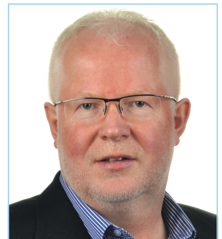
Klar for Teams-møte.

brukt hytta si mye i denne perioden, har truffet flere her nå enn jeg har gjort før på hverdager.