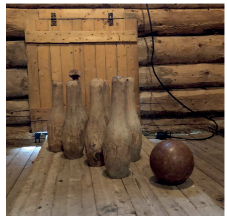
I dag er kjeglene og kulene flyttet til Rudstuen seter.