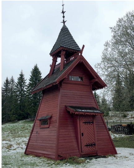
Klokketårnet fra 1899.

Jeg husker at klokketårnet ble brukt hver pinsekveld, da var det høytid. Da kunne klokkeklangen høres ned til Svingvoll. Det hender at klokkene brukes i dag også hvis det er noen familiesammenkomster.