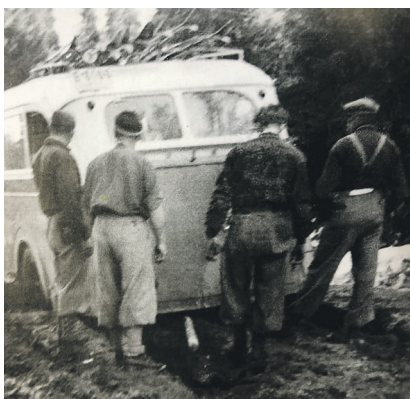
Teleløysing i Skeislia, påsken 1937. Vegen har gått i oppløsning og bussen, med ski på taket, sitter fast.