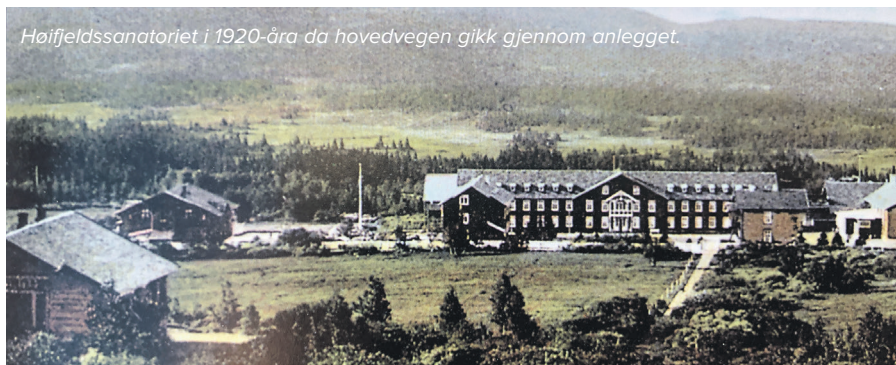
Høifjeldssanatoriet i 1920-åra da hovedvegen gikk gjennom anlegget.