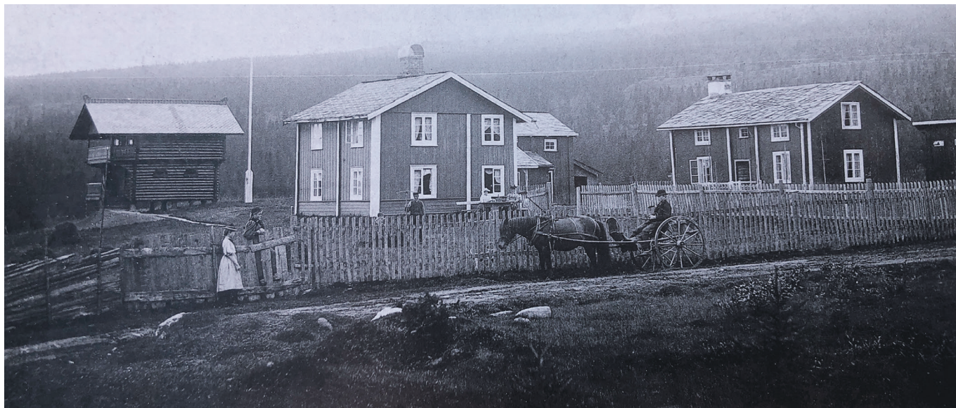
Holoa var et kjent landemerke på vegen Sveen-Sanatoriet. Derfra var det 5 km igjen opp til Skei. Vegen gikk like inn til stakittgjerdet og skigarden.

Det antas at seterfolket kjørte med hest og kjerre til setergrenda på Skei i tida før Høifjeldssanatoriet ble bygget i 1876. Sanatoriet måtte ha bedre vei enn kjerrevei for å kunne drive. En diligence, som på prærien i Amerika, med tre hester jevnstids i spann foran, trengte bedre veg enn hest og kjerre med pjank! Det var det som måtte til.