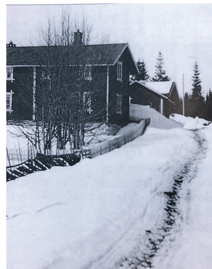
Vegen i Skeislia ved Blindjordslettet, eller Slette i daglig tale. Vinterstid før vegen ble brøytta til bilkjøring - før 1931. Hest etter hest, slede etter slede, lass på lass har pakka ihop vegen til ei renne. Midt i vegen ligger øykjemokka som et belte hele vegen.