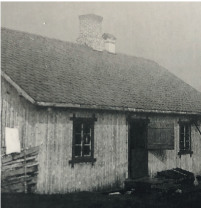
Skei Ysteri hadde drift 100 dager hver sommer.