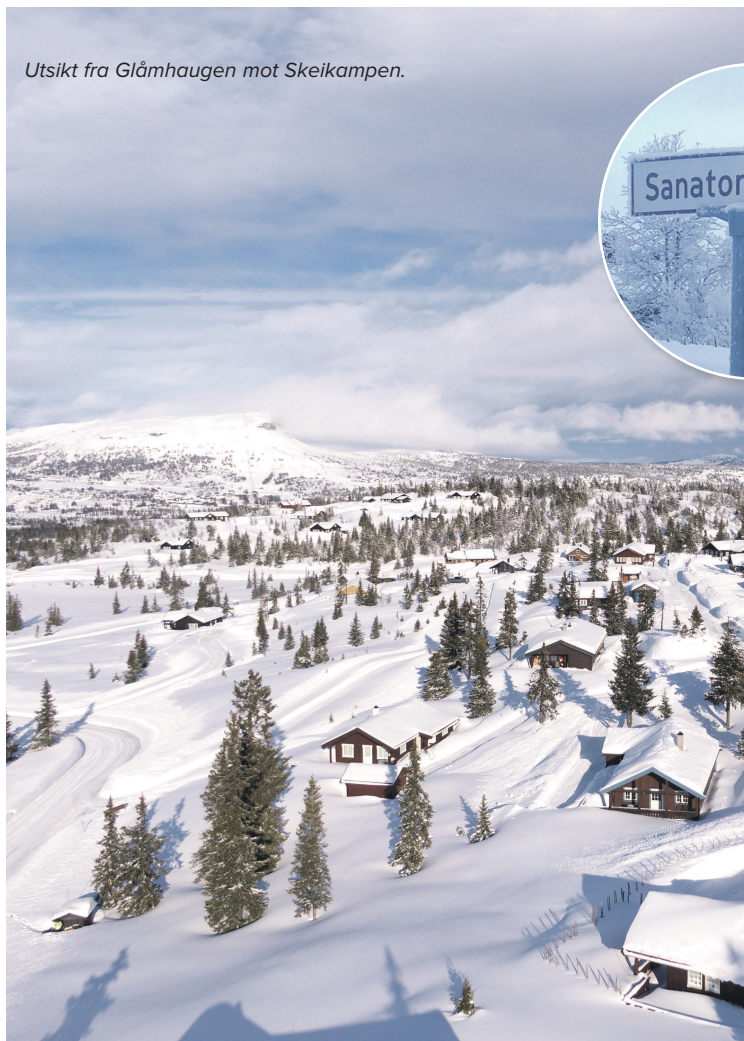
Utsikt fra Glåmhaugen mot Skeikampen.