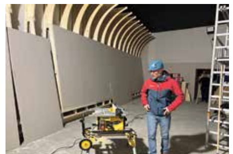
Ombyggingen har pågått siden høsten 2022.

Musikkfabrikken er spilt inn av Oslo-filharmonien som er Norges «nasjonalorkester» og et av Europas ledende symfoniorkestre. Oslo-filharmonien har de siste årene brukt vesentlige ressurser mot barn, unge og familier, som en langsiktig satsning for å sikre interessen for kulturarven med klassisk musikk. Innspillingen for Hunderfossen nye attraksjon gjøres vinteren 2023, i Oslo konserthus.