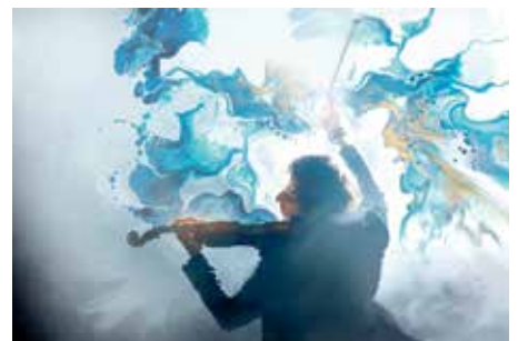
I Musikkfabrikken kan musikken oppleves med alle sanser.