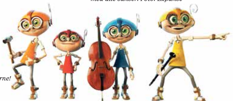
Møt de gøyale fabrikkarbeiderne!