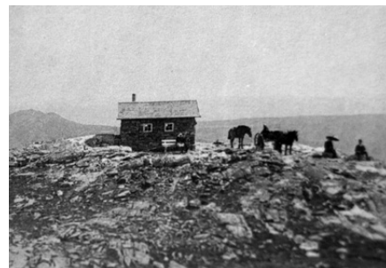
Når gjestene nådde steinhytta på toppen av Skeikampen ble de servert champagne og andre forfriskninger.