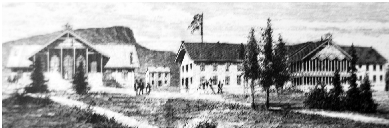
Bildet er laget av Otto Mankell etter fotografi. Dette er fra Ny Illustrerad Tidning i Stockholm 1878.