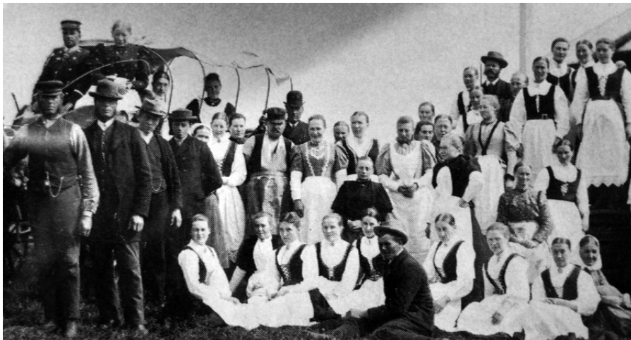
Diligensen halvt skjult av sanatoriets personale.