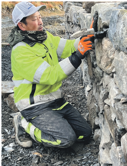
God presisjon på høyt nivå.