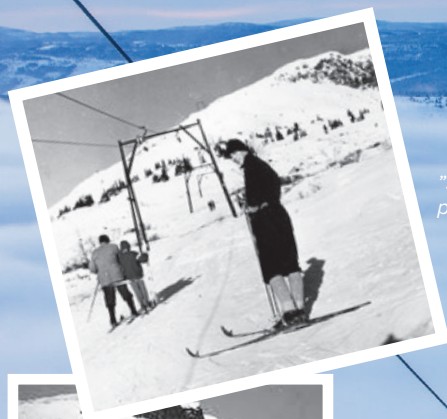
"Stor-heisen" på 60-tallet