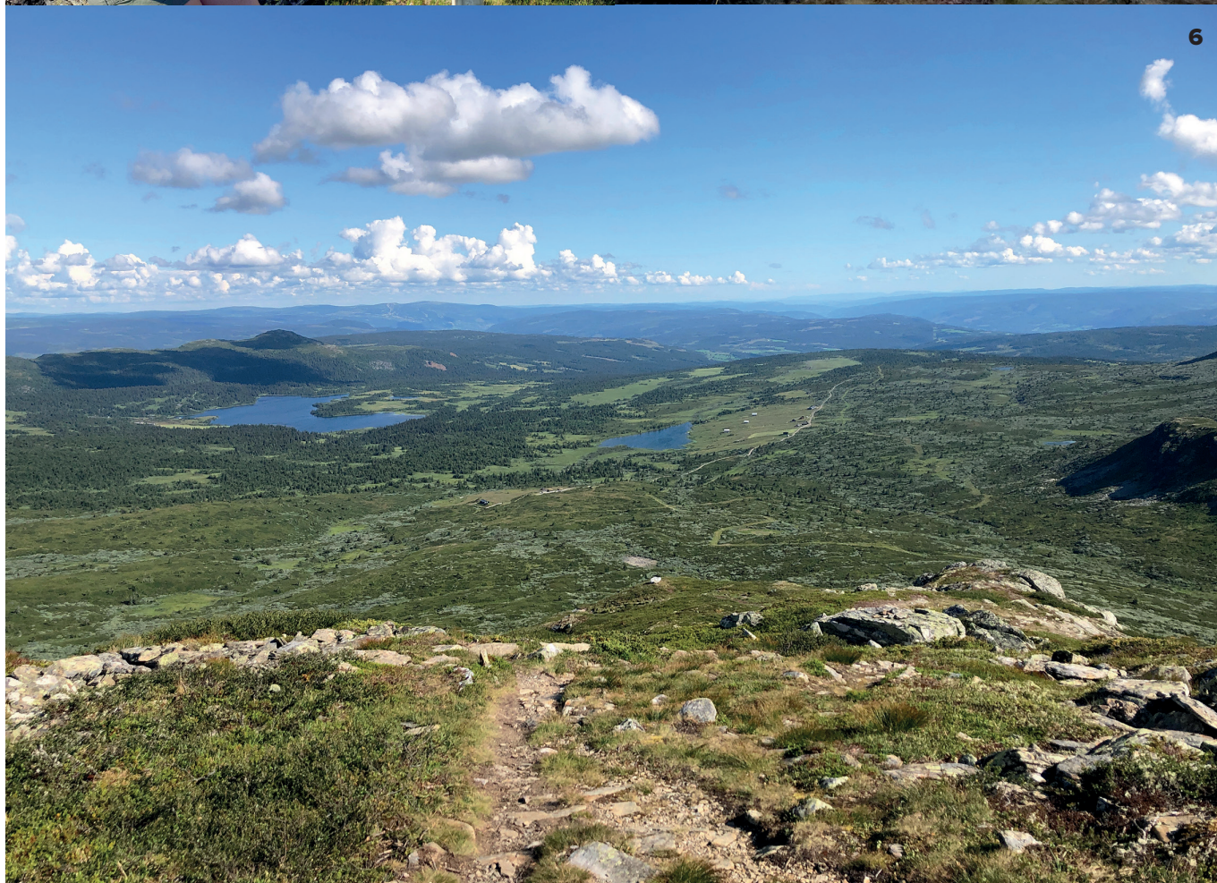
1. Ved Torsdalsvatnet. 2. Sykkeltur til Dørdalsknappen. 3. En pust i bakken. 4. Følg skiltet mot Krok tjernet fra Gamledalen. 5. Koselig kveldstemning i teltet ved Nedre Massingtjønnen. 6. Utsikt fra Prestkampen mot Torsdalen.