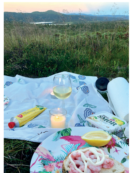
Rekeaften ved teltet i Gamledalen.

Majonesen som hadde sittet fast på rekene lå nå som en stor S på duken. Teltkameraten så på duken, smilte og sa – Kan du lage til meg også?