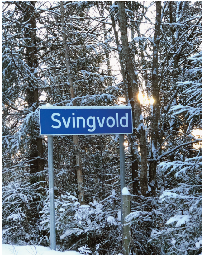
Trippelmordet i Svingvold er en ukjent tragedie for mange i dag