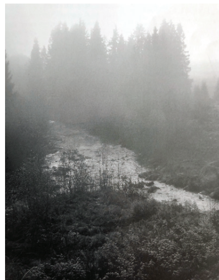
Her møtes Killielva og Skeiselva ved gamle Madsbakken.